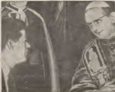
Aki riba Papa Pablo VI, den e Palacio Apostolico di Vaticano, ta recorda president Kennedy cu ya nan tabata conocé otro otro cuha di antes, tempo di coronacion di Pio XII.

Den e aspecto nacional tin cuestionnan importante pa worde discuti, e.o. e derechonan civico, e deficit di e presupuesto, e ocho mil millon den e aña fiscal di 1963, e alto nivel di desempleo, e diferencianan grandi entre tur dos partido en relacion